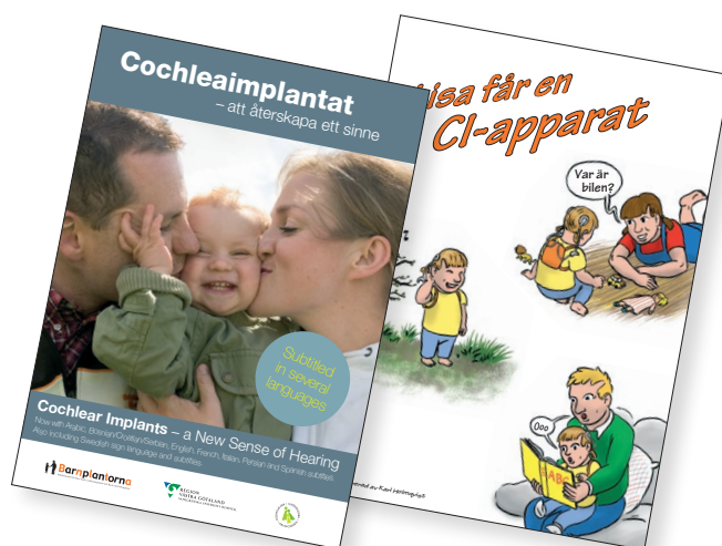
Bilderbok (12 sidor)